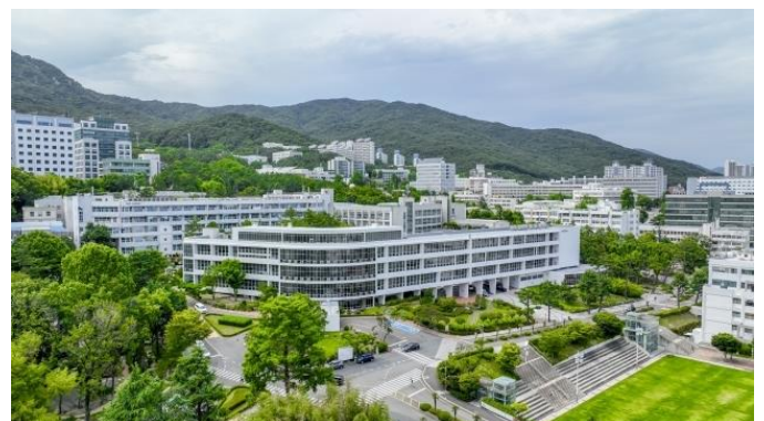
부산대학교 전경